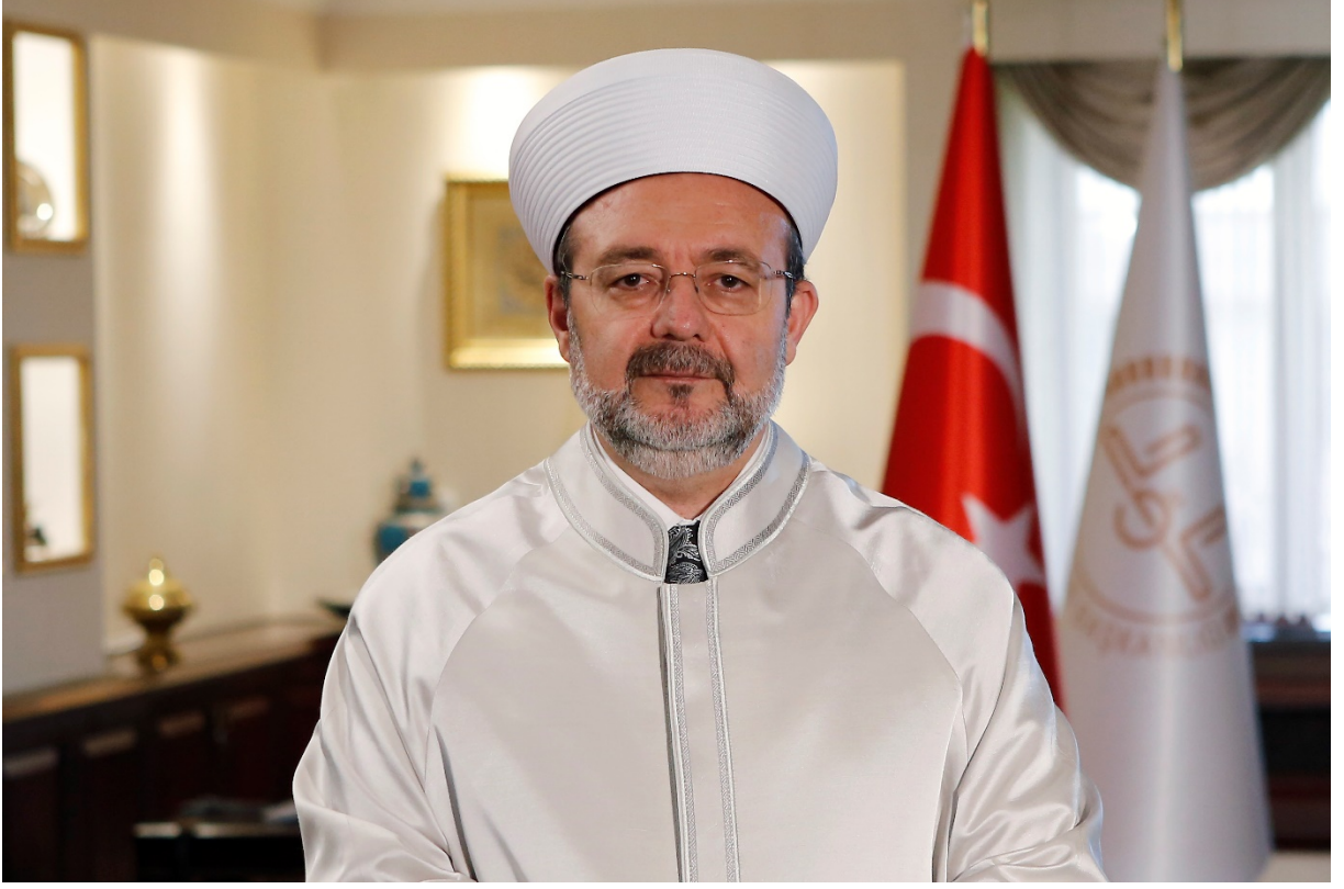
Prof. Dr. Mehmet GÖRMEZ Diyanet İşleri Başkanı